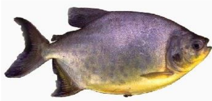
O PACÚ FUJÃO

A pescadora Ucha, que visita o doutor Chaparral como desculpa. Na pescaria mais recente pegou pacupevas, piavas, piau e um pacu.